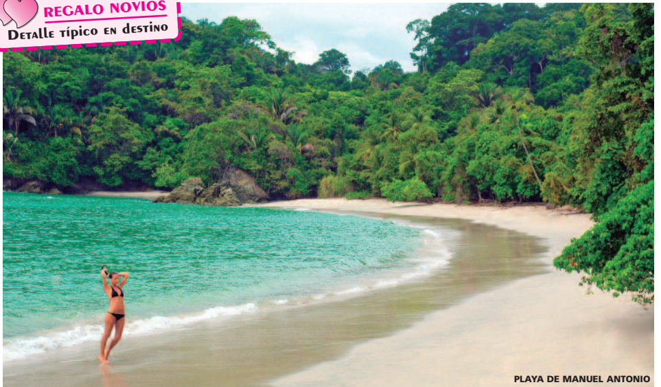
PLAYA DE MANUEL ANTONIO