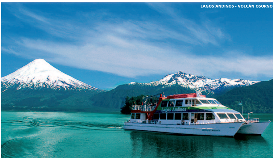
LAGOS ANDINOS - VOLCÁN OSORNO