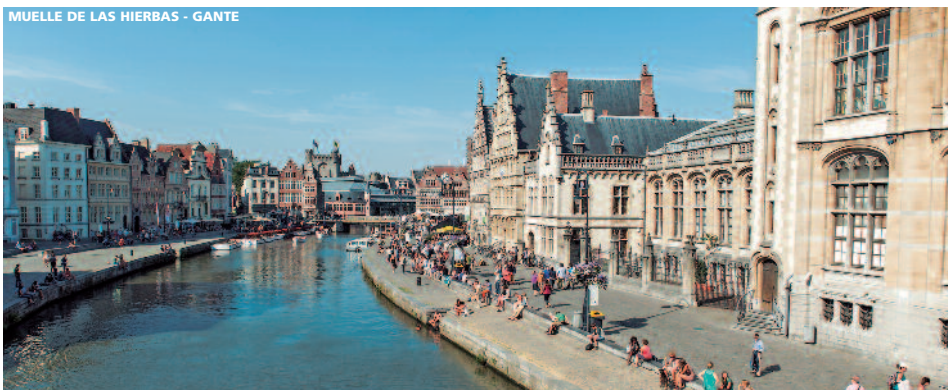
MUELLE DE LAS HIERBAS - GANTE