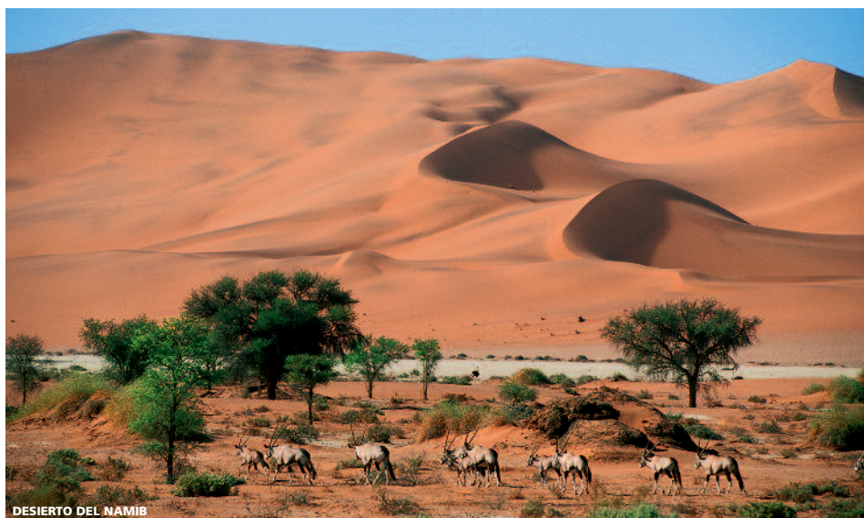
DESIERTO DEL NAMIB

12 días (9n hotel + 2n avión) desde 3.140 €