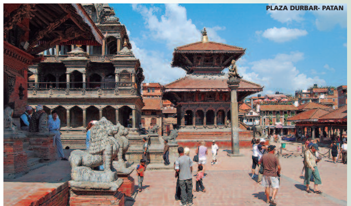
PLAZA DURBAR- PATAN

HOTELES PREVISTOS (o similares): Kathmandú: Soaltee Crowne Plaza (Primera Superior)