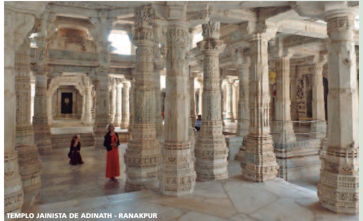
TEMPLO JAINISTA DE ADINATH - RANAKPUR