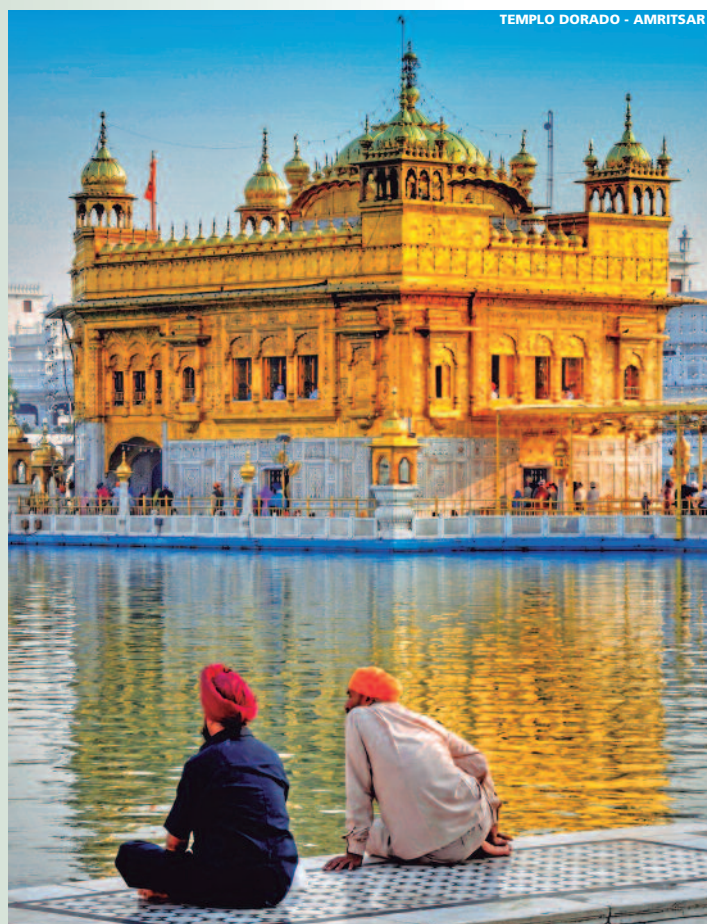
TEMPLO DORADO - AMRITSAR

Notas muy importantes: - Todos los precios son en Euros con un mínimo de 2 personas. - El parque de Ranthambore está cerrado de Junio a Septiembre 2018. - Posibilidad de cambiar el hotel en Maldivas. Consultar. - Consultar suplementos a partir del 30 Septiembre 2018.