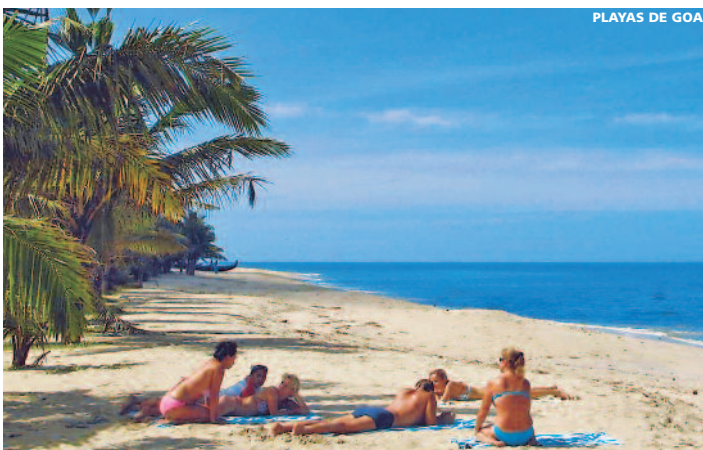
PLAYAS DE GOA