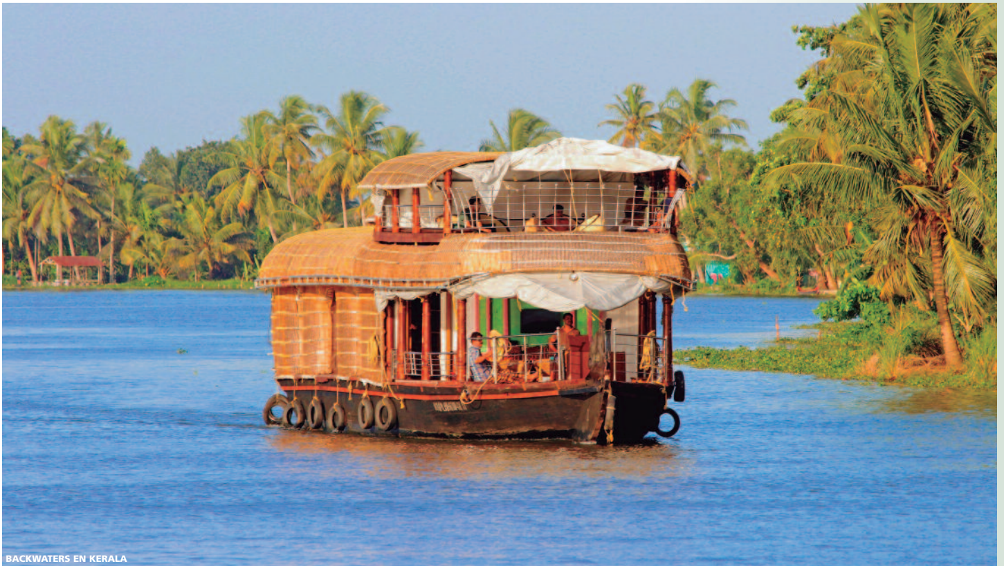
BACKWATERS EN KERALA

rar su flora y su fauna. Alojamiento en el hotel.