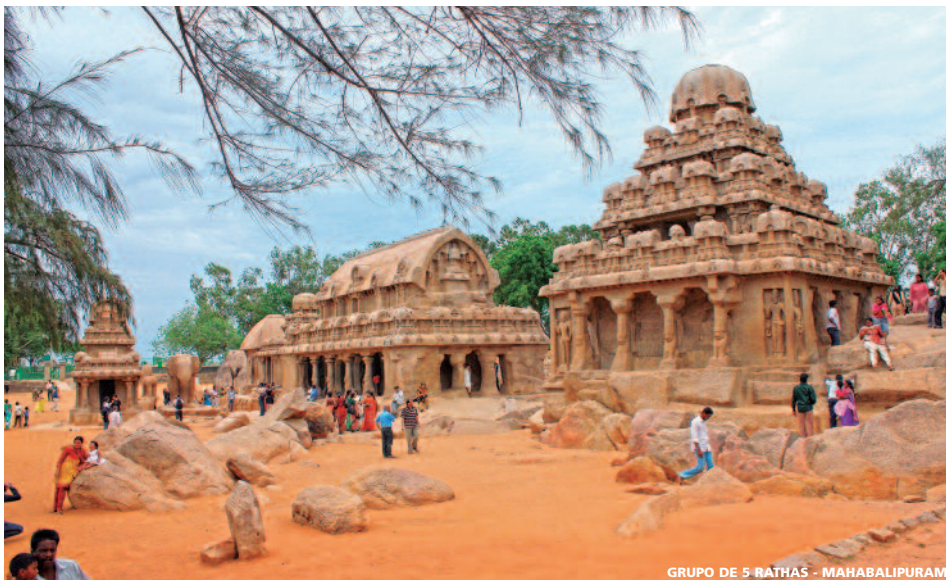
GRUPO DE 5 RATHAS - MAHABALIPURAM

Salida por carretera hacia Thekkady , situado en las montañas de Nilgri Hills, llenas de plantaciones de especias. Por la tarde, realizaremos un recorrido en barco por el Lago Periyar , reserva de vida animal en el estado de Kerala, donde podremos admi-