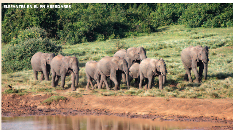
ELEFANTES EN EL PN ABERDARES

templar aves acuáticas y familias de hipopótamos. Precio aprox. 45 USD, pago en destino). Salida por carretera hacia Masai Mara , la reserva más famosa de Kenia. Sus 320 km² de sabana, bosques y ríos, crean un ecosistema único por su gran valor ecológico y por su enorme biodiversidad. Por la tarde, realizaremos un safari . Alojamiento en el lodge. Día 5º Masai Mara • Sábado o Domingo • Desayuno + almuerzo pic-nic + cena. Día dedicado a recorrer la reserva de Masai Mara . Es fácil observar grandes manadas de ñus, cebras y gacelas. Estos atraen también a los grandes depredadores como leones y guepardos, especialmente por la mañana, cuando salen de cacería. Alojamiento en el lodge. Día 6º Masai Mara/Nairobi/París • Domingo o Lunes • Desayuno + almuerzo. A la hora indicada regreso por carretera a Nairobi. Llegada y almuerzo en el Restaurante Carnivore . Traslado al aeropuerto para salir en vuelo con destino París. (Noche a bordo). Día 7º París/España • Lunes o Martes • Desayuno. Llegada a París y conexión con vuelo destino España. Llegada.