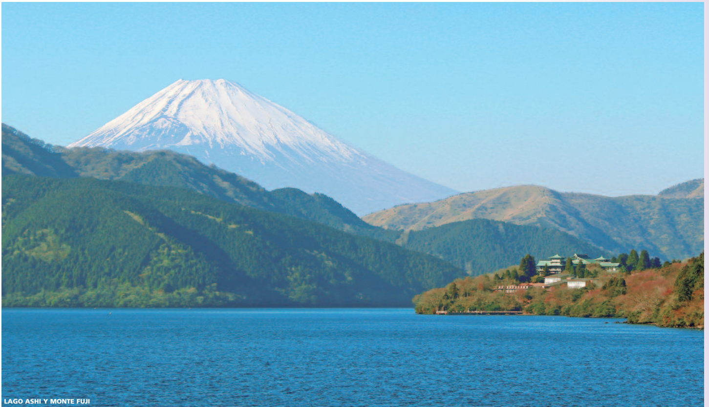
LAGO ASHI Y MONTE FUJI

y el centro olímpico de natación conocido como el "Cubo de Agua". Por la noche disfrutaremos de una cena típica en la que degustaremos el "Pato Laqueado" . Alojamiento en el hotel.