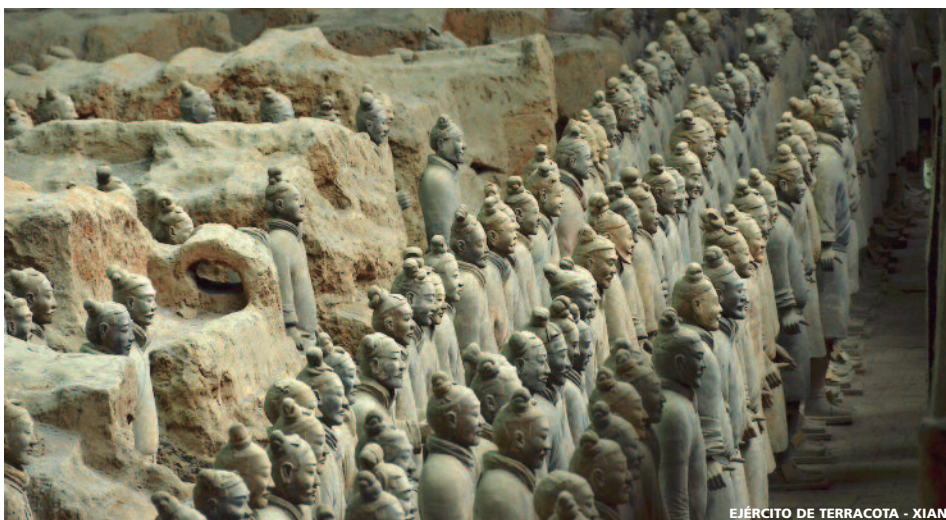
EJÉRCITO DE TERRACOTA - XIAN

• Miércoles • Desayuno buffet + almuerzo. Excursión de día completo incluyendo la Gran Muralla y el Palacio de Verano. Durante el trayecto podemos observar desde el autobús el estadio Olímpico "Nido de Pájaro"