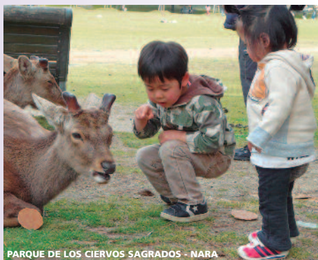
PARQUE DE LOS CIERVOS SAGRADOS - NARA