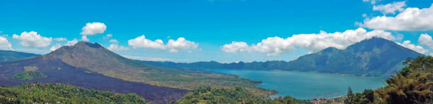
VOLCÁN Y LAGO BATUR - KINTAMANI

Por la mañana saldremos hacia el Río Ayung para hacer rafting (2 h aprox.). Para aquellos que no quieran el rafting, podrán montar en elefante media hora y esperar en el bar-restaurante donde finaliza el rafting y se servirá el almuerzo. Por la tarde parada en Mengwi (Templo real Taman Ayun) y ascenso hacia la zona montañosa de Bedugul. Visita del templo Ulundanu del lago Beratan y continuación hacia el famoso templo Tanah Lot , uno de los más populares