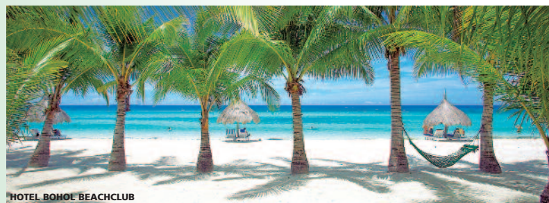
El nombre genérico de Bohol comprende Panglao y Tagbilaran

La isla de Bohol se encuentra situada en el corazón del archipiélago de Filipinas, al sur de Visayas centrales. La capital de esta provincia rodeada de islas es Tagbilaran y a menos de 1 km está la isla de Panglao que posee una de las mejores y más bonitas playas comparada en múltiples ocasiones con la White Beach de Boracay, estamos hablando de las Playas de Bohol. Las Playas en la isla de Mactan no las recomendamos.