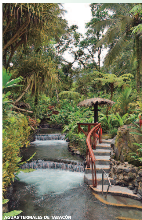
AGUAS TERMALES DE TABACÓN