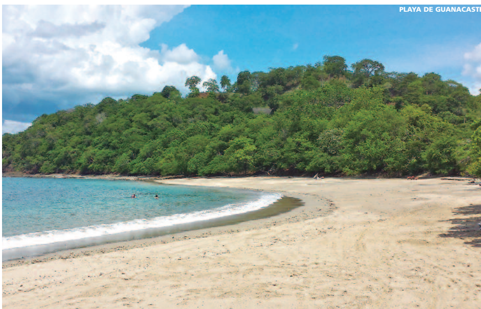
PLAYA DE GUANACASTE

Incluyendo 8 DESAYUNOS, 3 ALMUERZOS, 2 CENAS, 2 VISITAS TODO INCLUIDO en GUANACASTE