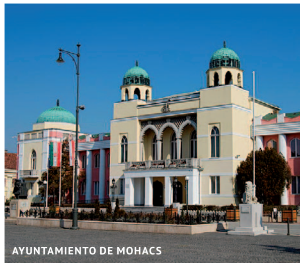
AYUNTAMIENTO DE MOHACS