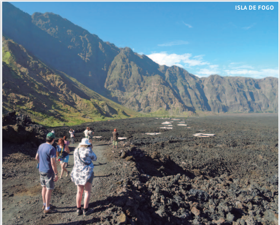
ISLA DE FOGO