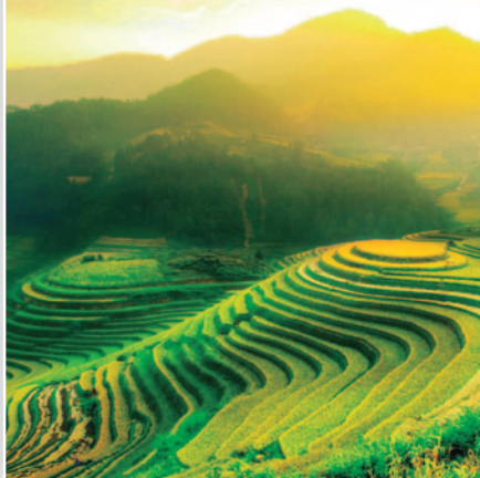
Terrazas de Arroz de Bali