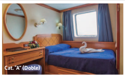
Cat. "A" (Doble)