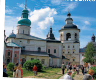
SAN CIRILO DEL LAGO BLANCO

- Visita Panorámica. En las confluencias de los ríos Kotorols y Volga está situada la ciudad más grande del Anillo de Oro, Yaroslavl. Fundada en el siglo X por el príncipe ruso Yaroslavl el Sabio. Gran centro turístico que conserva monumentos históricos y arquitectónicos como la Iglesia del Profeta Elías, La Iglesia de la Natividad de Cristo y San Miguel Arcángel. Su centro urbano ha sido declarado "Patrimonio de la Humanidad" por la UNESCO en 2005. Monasterio de la Transfiguración: Es la construcción más antigua de la ciudad, formada por la Iglesia de 5 cúpulas y la torre de aguja dorada. Iglesia del profeta Elías donde podemos apreciar sus frescos pintados por uno de los iconografos más destacados del siglo XVII, Nikita Gouriyev. Los artistas plasmaron en los frescos únicamente escenas de la vida cotidiana, por lo que su visita nos da una idea de cómo se desarrollaba la vida en Rusia en el siglo XVII.