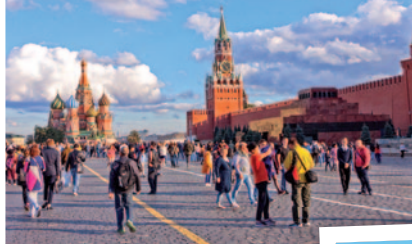
PLAZA ROJA - MOSCÚ

- El Kremlin. Recinto amurallado origen de la ciudad, a cuyo alrededor fue creciendo. Aquí se encuentra el Consejo de Ministros, el enorme Cañón Zar (que nunca fue disparado), la monumental Campana Zarina, así como las Catedrales de la Asunción, la Anunciación y San Miguel Arcángel. Visita del recinto y del interior de una de las catedrales.