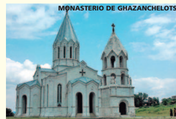
MONASTERIO DE GHAZACHELOTS

Salimos hacia Shushi. En el camino visita-