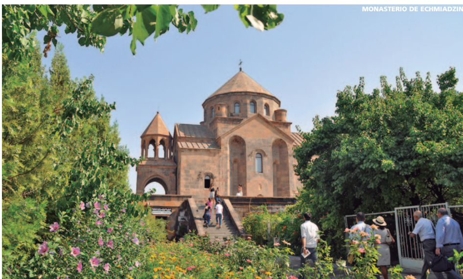
MONASTERIO DE ECHMIADZIN

7 días (6 noches de hotel) desde 900 € SIN AVIÓN desde 750 €