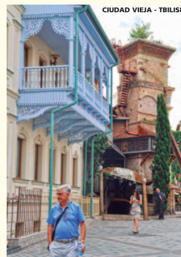
CIUDAD VIEJA - TBILISI

A la hora indicada se realizará el traslado al aeropuerto para tomar el vuelo regular de regreso a España.