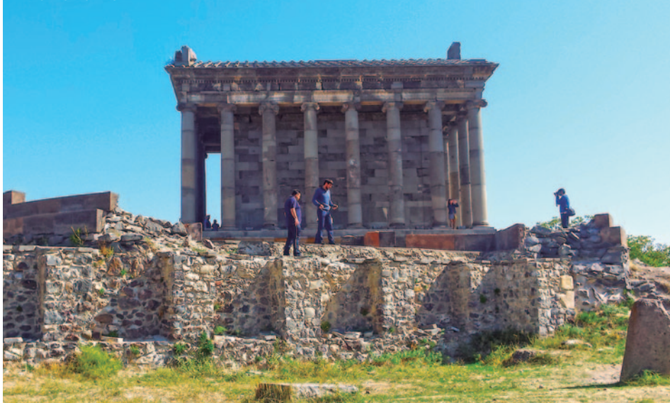
TEMPLO PAGANO DE GARNI

• Desayuno + almuerzo. A primera hora salimos hacia Echmiadzin , declarada Patrimonio Mundial por la UNESCO, es la primera iglesia cristiana del mundo (año 303 a.C.), centro espiritual y residencia