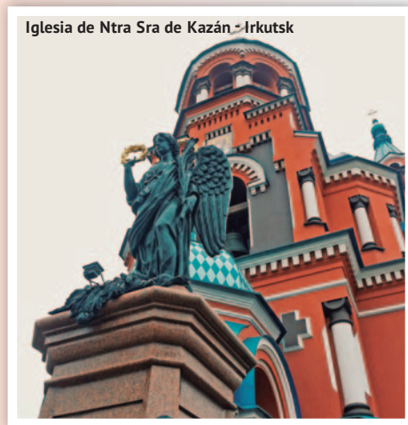
Iglesia de Ntra Sra de Kazán - Irkutsk

• Domingo • Desayuno. Traslado de salida al aeropuerto.